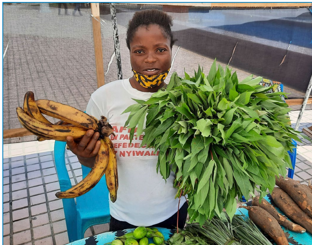
Une agricultrice du Réseau National des Femmes Rurales présente sa production lors de la foire organisée à Kinshasa en novembre 2020.