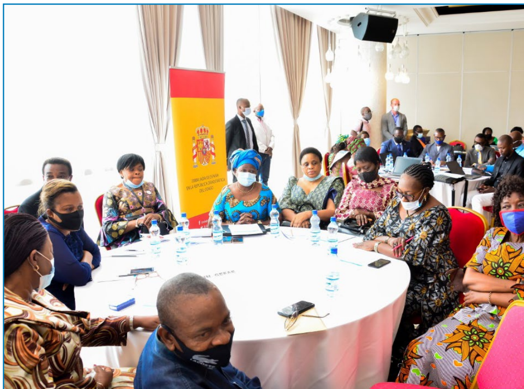
Le Groupe Inter-Bailleurs Genre, la MONUSCO et l'ONU Femmes ont appuyé le ministère du genre, famille et enfant dans l'organisation, à Kinshasa, des journées portes ouvertes, en marge de la commémoration du 20ème anniversaire de la résolution 1325 du conseil de sécurité des Nations Unies. Les travaux ont été organisés sous format d'échanges autour du thème : "agir pour soutenir les femmes artisanes de la paix".