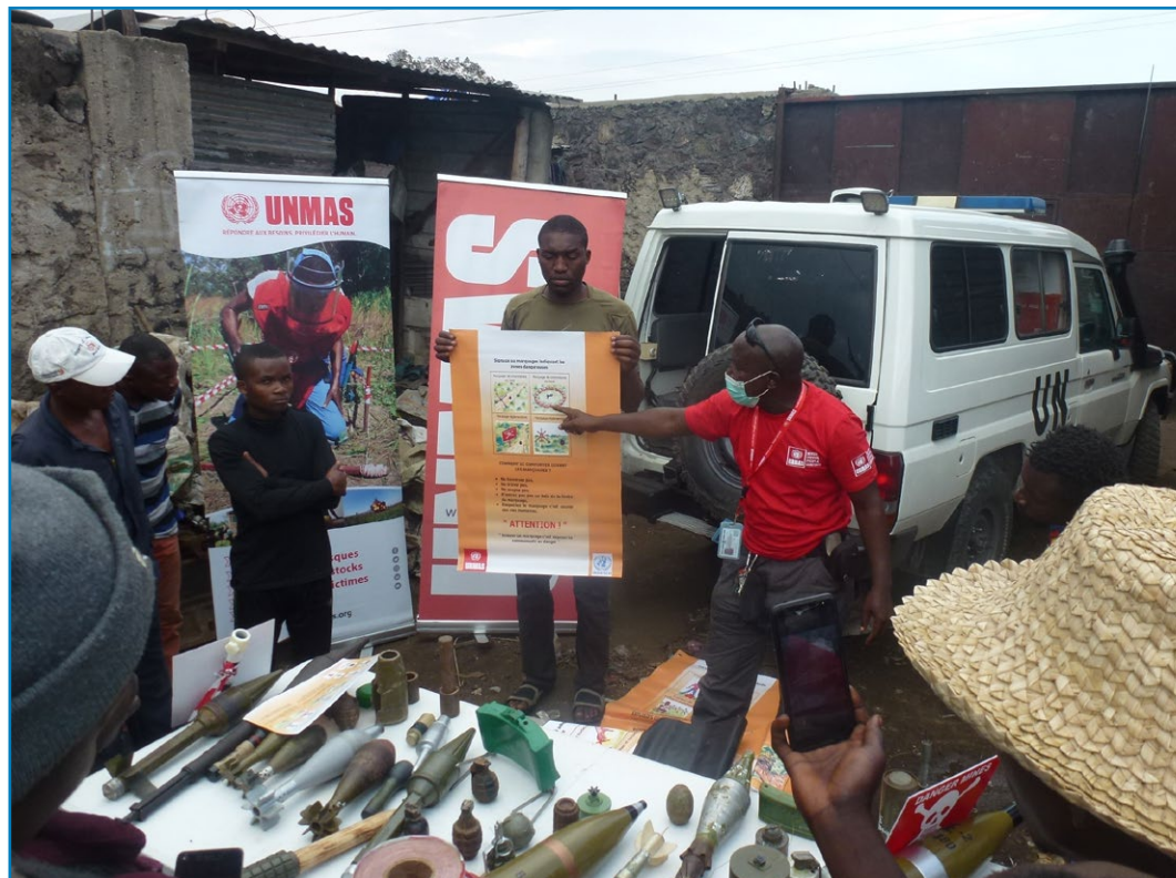
Séance de sensibilisation et d'éducation aux restes explosifs de guerre dans le Territoire de Rutshuru (Nord Kivu).