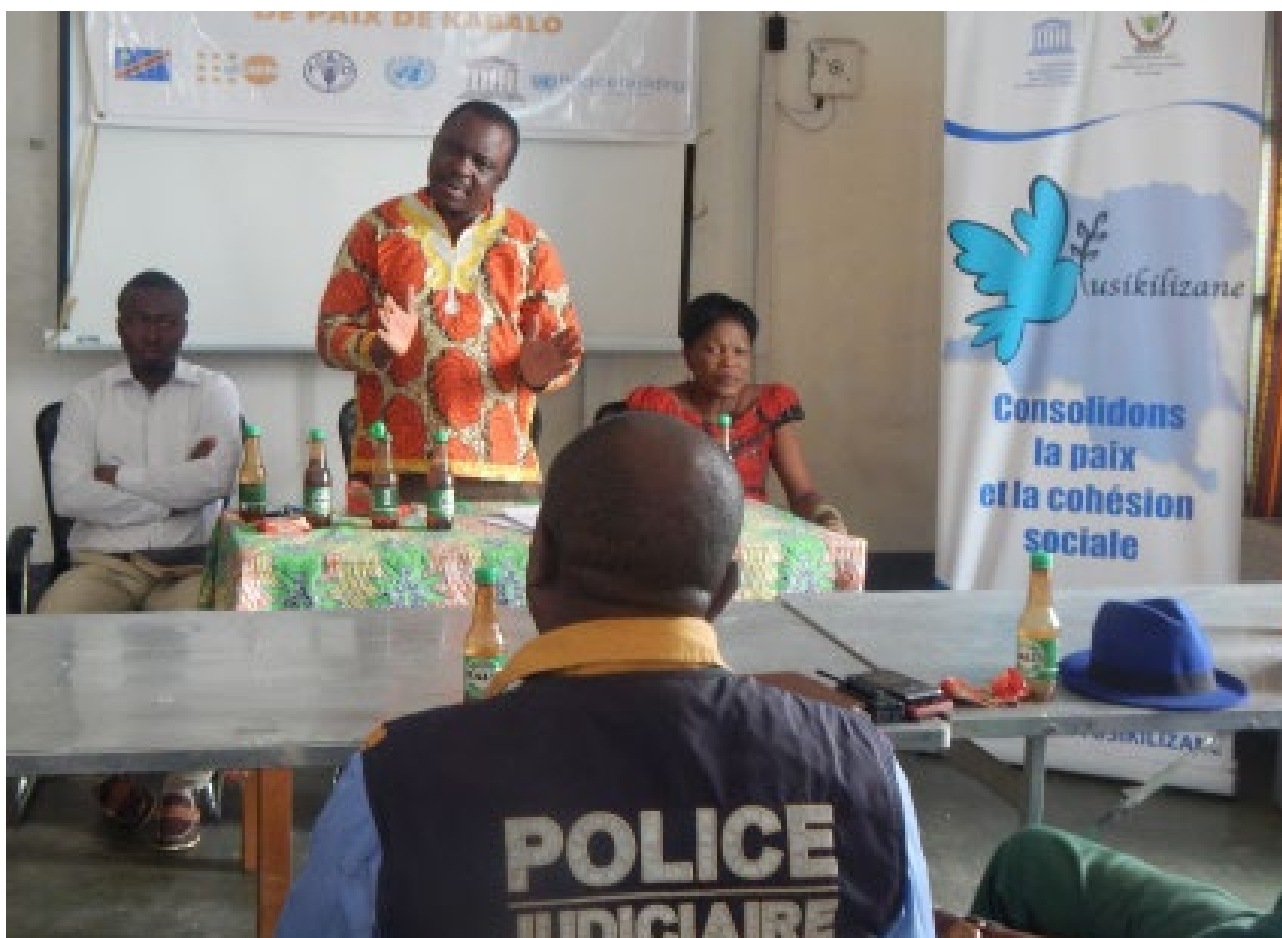
Vue partielle d'une réunion du conseil territorial de paix de Kabalo, un des résultats du projet financé par le PBF dans le Tanganyika.

Les partenaires de l'approche Nexus et le Gouvernement congolais se sont accordés de centrer dans un premier temps l'attention de leurs actions sur le Kasai et le Tanganyika en raison notamment du retrait planifié de la MONUSCO de ces zones et du transfert progressif des activités de la Mission aux partenaires compétents. Des projets du PBF sont aussi en cours de mise en œuvre dans ces provinces pour assurer des synergies.