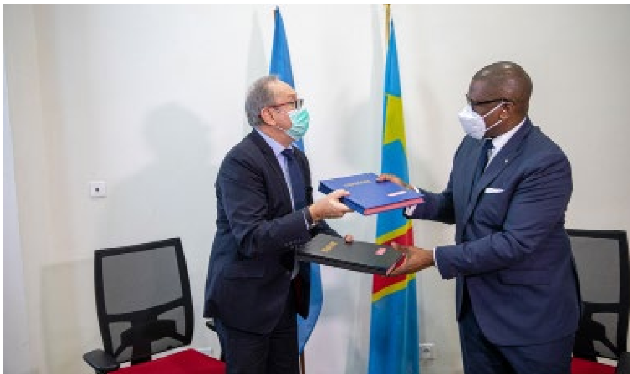
Le Coordonnateur résident et le Ministre d'Etat à la Coopération échangeant les signataires au lancement du plan des Nations Unies pour l'appui à la riposte contre la COVID-19 à Kinshasa en Juin 2020.