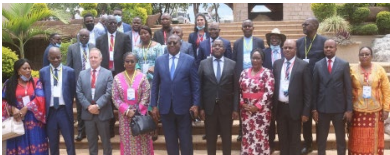
Rencontre des partenaires techniques et financiers de l'OIT avec le Ministre National des Mines et le Gouverneur de la Province du Lualaba, en marge de l'atelier de concertation dans la lutte contre le travail des enfants dans les mines artisanales.

Dans un effort de mieux mobiliser les ressources, l'Equipe de Pays va se doter d'une stratégie en mobilisation des ressources en 2021.