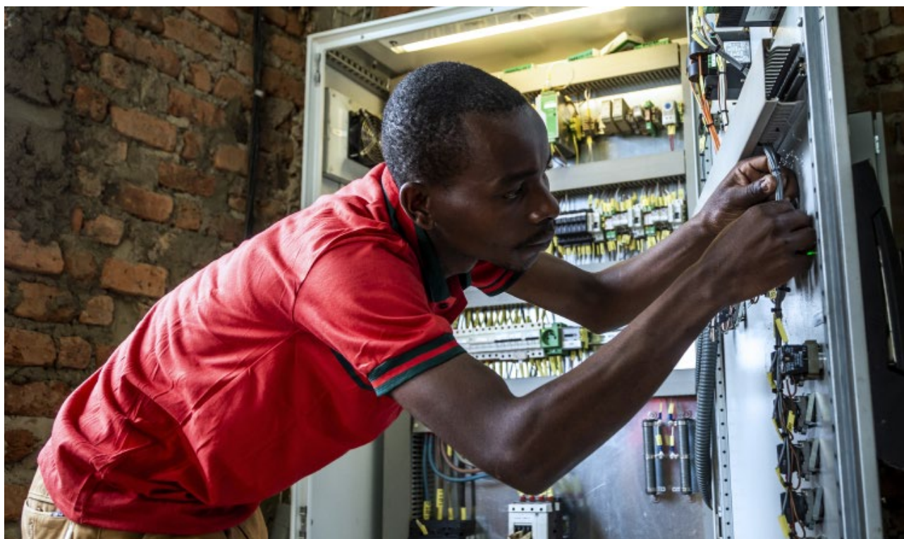
Travaux d'installation de la microcentrale hydroélectrique de Bitale construit sur la rivière Cibayi, territoire de Kalehe, Province du Sud-Kivu. Un projet du Programme des Nations Unies pour le Développement.

Les ODD ne pourront pas être réalisés sans la mise en place des partenariats solides. Etant donné que les flux d'aide sont en baisse et que la pandémie de COVID-19 et ses conséquences économiques mondiales risquent de les diminuer davantage, la mise en œuvre de l'agenda du développement en RDC requiert un partenariat inclusif à tous les niveaux. Les partenariats innovants constituent un levier important pour atteindre les ODD et le développement des partenariats stratégiques est une exigence incontournable pour la réalisation du Cadre de Coopération en RDC.